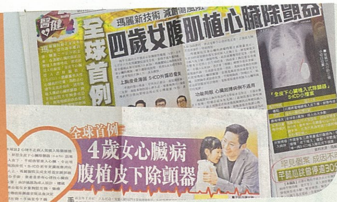
2018年新聞報道芊芊成為全球首宗40公斤以下在腹部皮下安裝新式心臟除顫器的個案。